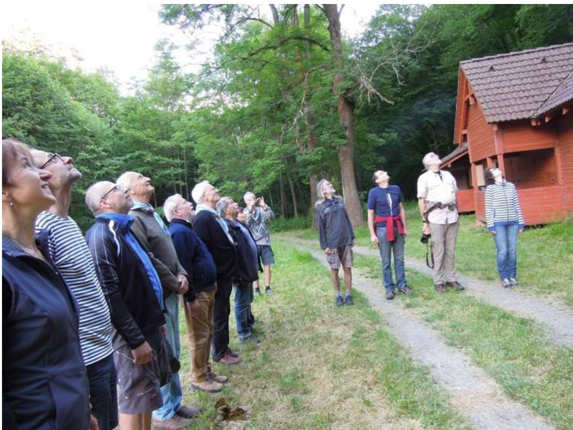
Nástup byl ukázněný...