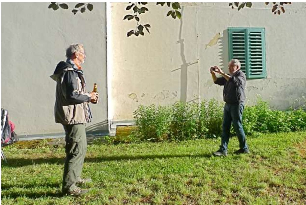
Fotografové v akci: Mahu...