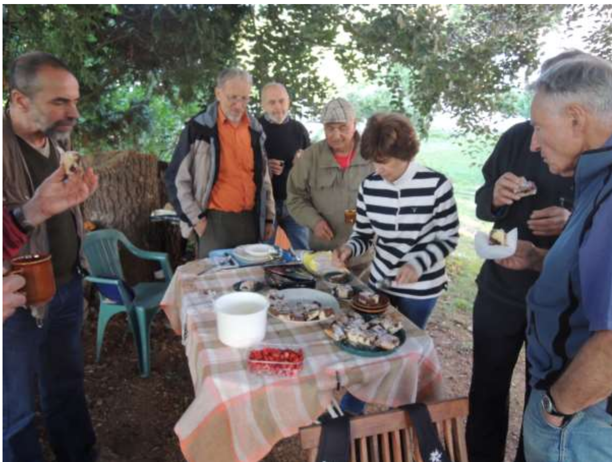
Na těchto fotografiích je pozoruhodná chtivost, která se v našich pohledech zračí.