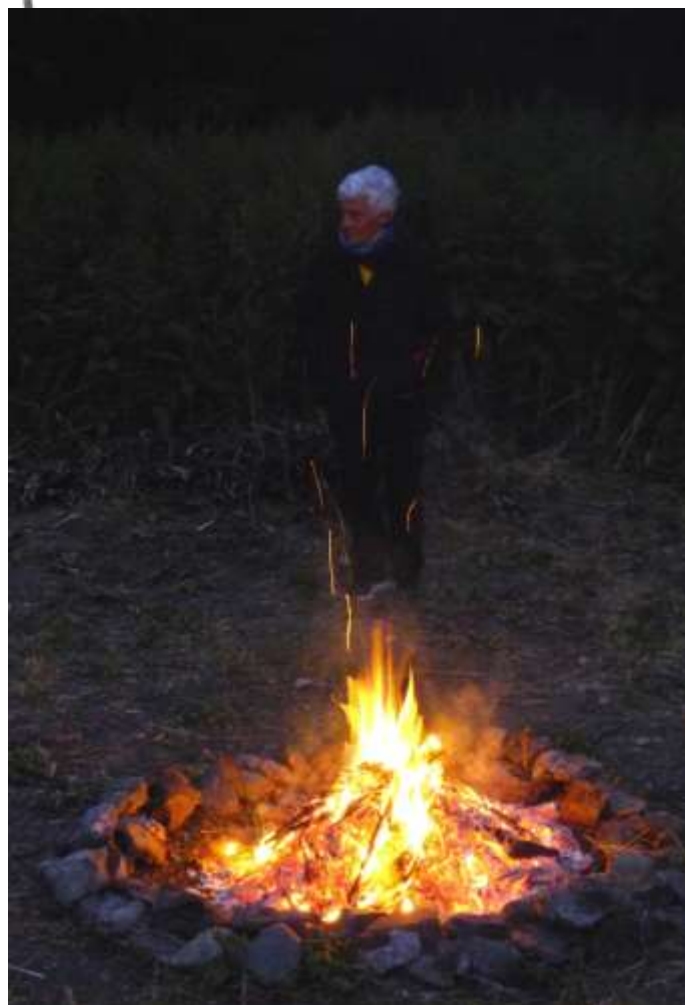
49. Nižborský táborák 2017