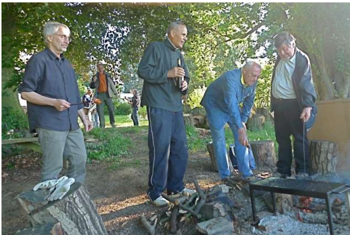
Když jsme „sežrali“ kotlety a pečené brambory, tak jsme se vrhli na buřty