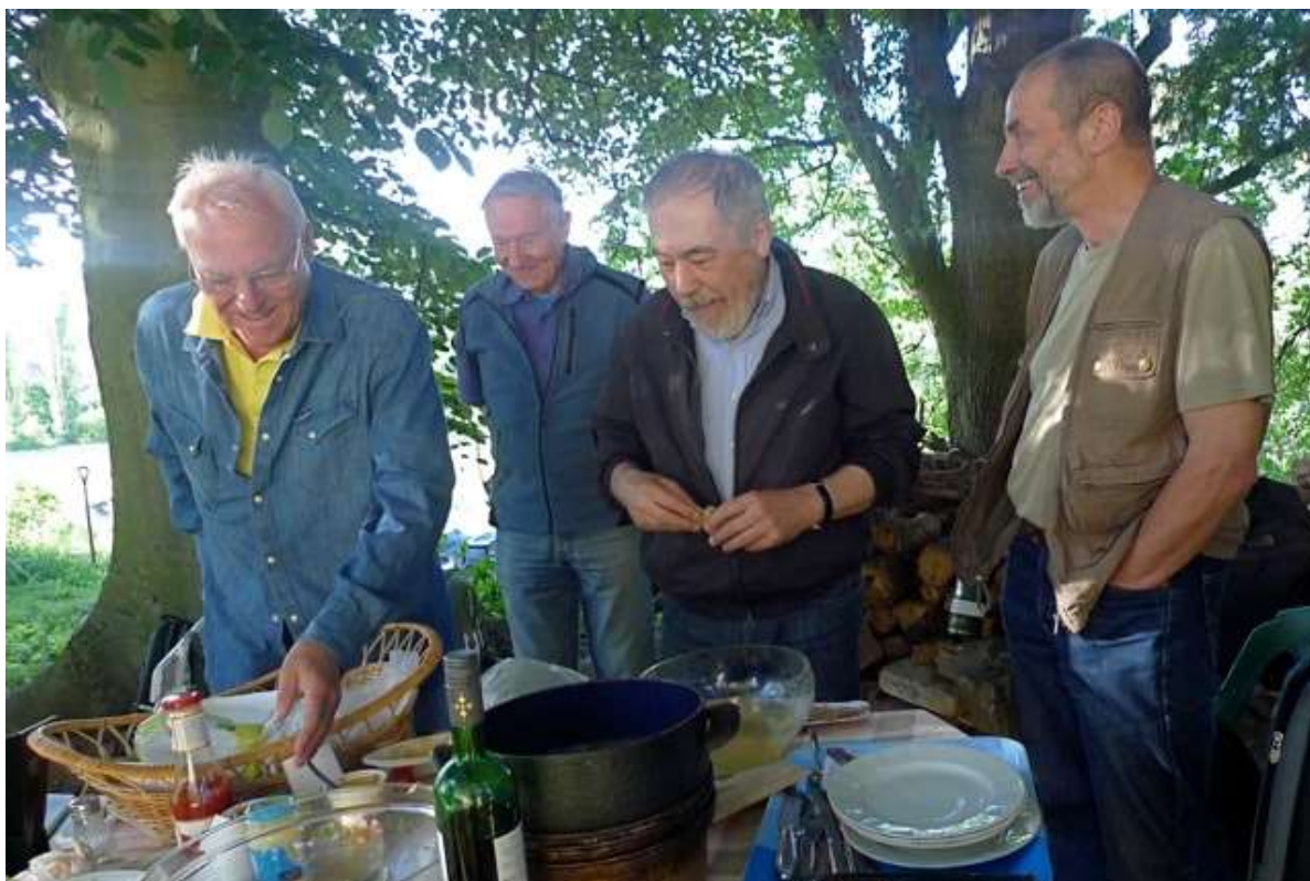
Golfík se přijel ze Švýcarska pořádně najíst