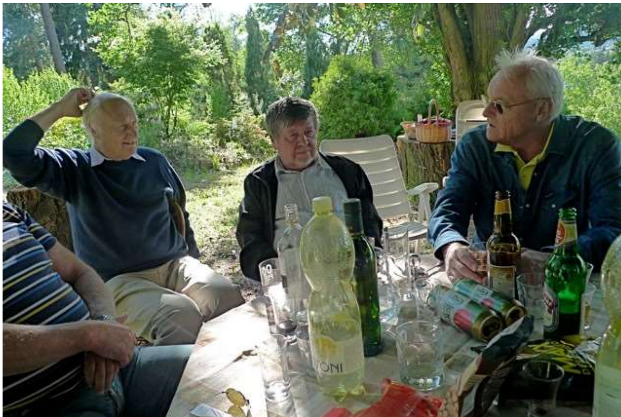
Ale také jsme se kulturně bavili