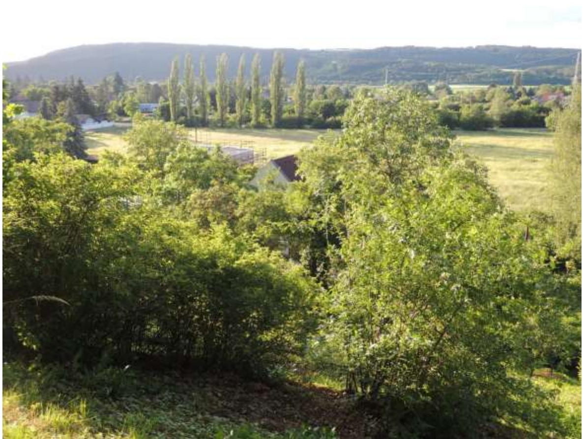
A nakonec pohled do údolí Berounky