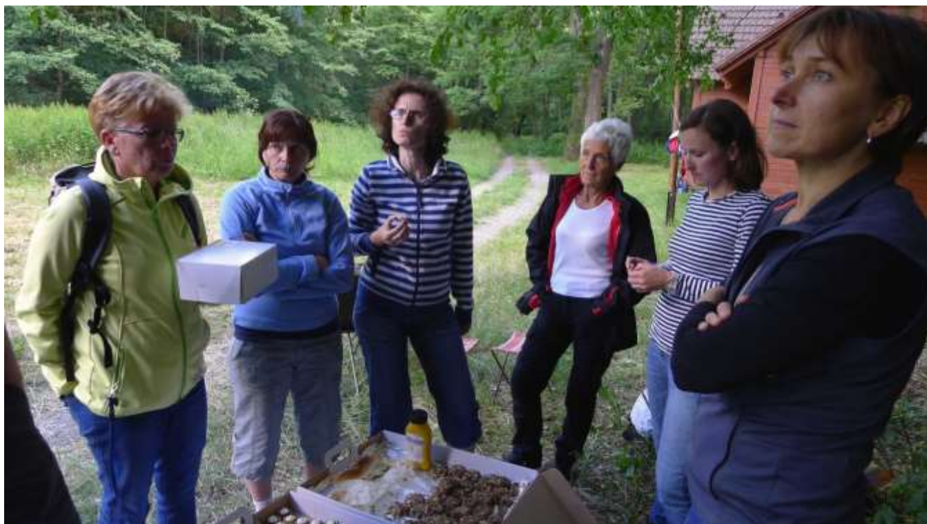
...ale byly i další dárky.