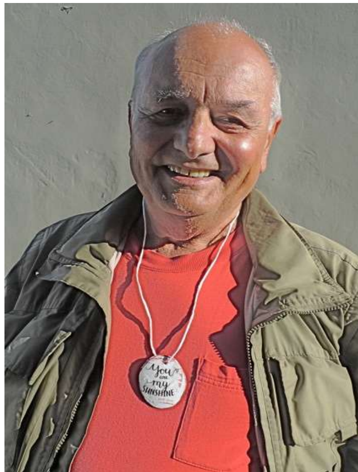
You are my sunshine