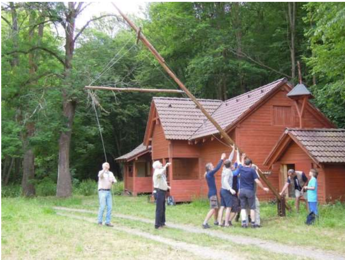
Během hodování jsme museli opravit přetrhnuté lanko na oddílovém stožáru